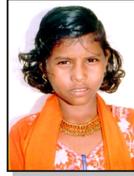
जुबरे मुक्ता ३०० पुज