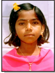
पोले सारिज ३०० पुज