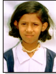
स्वामी भाज्यश्री ३०० पुज